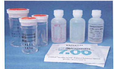
土壌測定用目盛付振とう容器と校正用EC標準液を付属